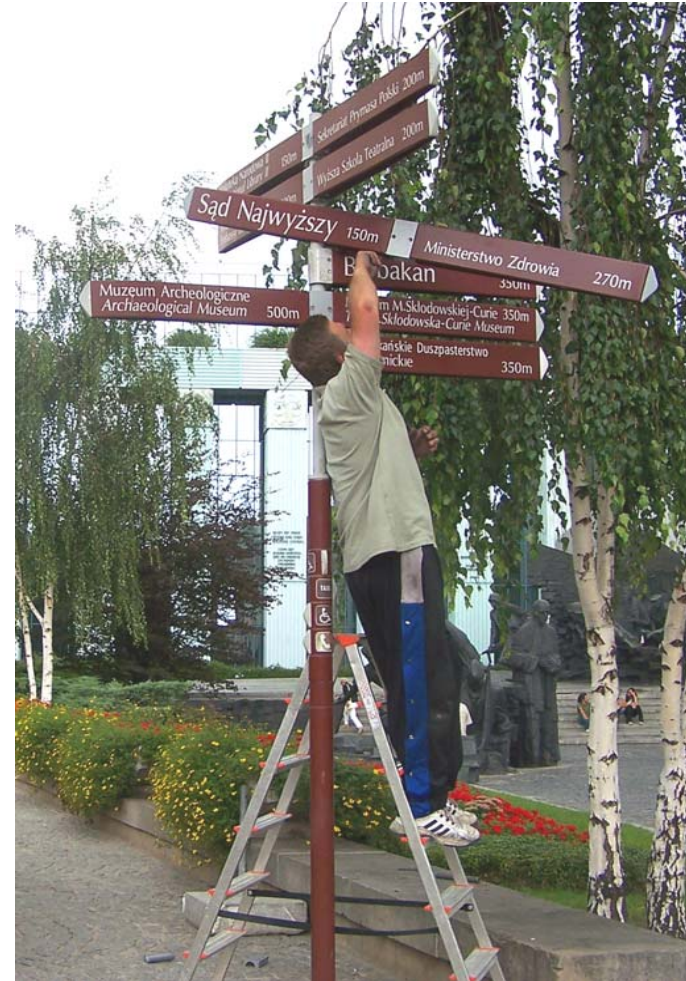
Rospuda, Ticha Dolina czy skażenie terenu PZL-Świdnik (czy tylko?) bezwodnikiem chromu - zaiste liczyć mogą już chyba tylko na TEN (spójrz w niebo, Czytelniku) Sąd Najwyższy...