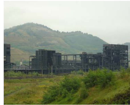
Copsa Mica - smutna spuścizna Ceausescu.