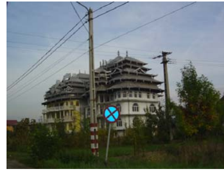
Pałac cygański koło Turdy.

Pojawienie się działaczy Nowej Lewicy - w tym ich lidera, Piotra Ikonowicza - w OZZ Inicjatywa Pracownicza, wywołało małą burzę wśród wolnościowych związkowców. Okazało się, że chcąc nie chcąc, doszło do zjednoczenia anarchosyndykalistów z lewicą partyjną; że od teraz działamy w jednej grupie, walczymy wspólnie. Wspólnota ta jest jednak czysto formalna i bardzo krucha. W tej perspektywie wydaje się sensowne rozpoczęcie publicznej debaty między anarchosyndykalistami a zwolennikami partii, zwłaszcza po opublikowaniu wywiadu w 13. numerze Biuletynu OZZIP. Do takiej dyskusji zachęca również tekst Antykapitalizm Nowej Lewicy. Czuję się zobowiązany do przedstawienia swoich racji i zabrania stanowiska w tym sporze.